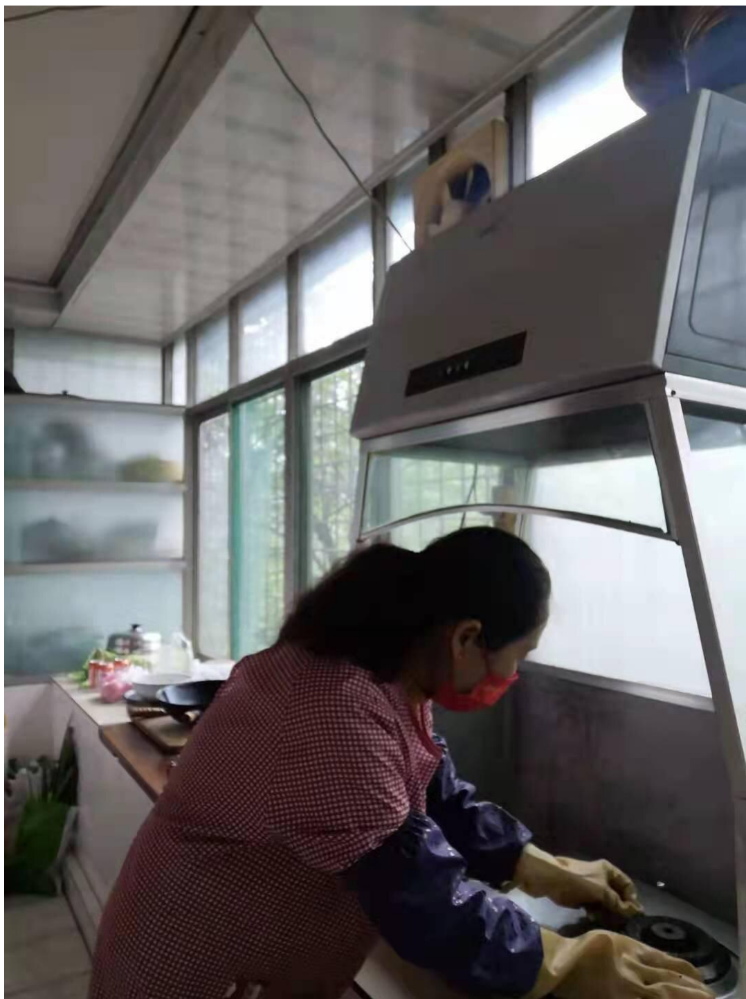
图 4-1 养老机构家政服务