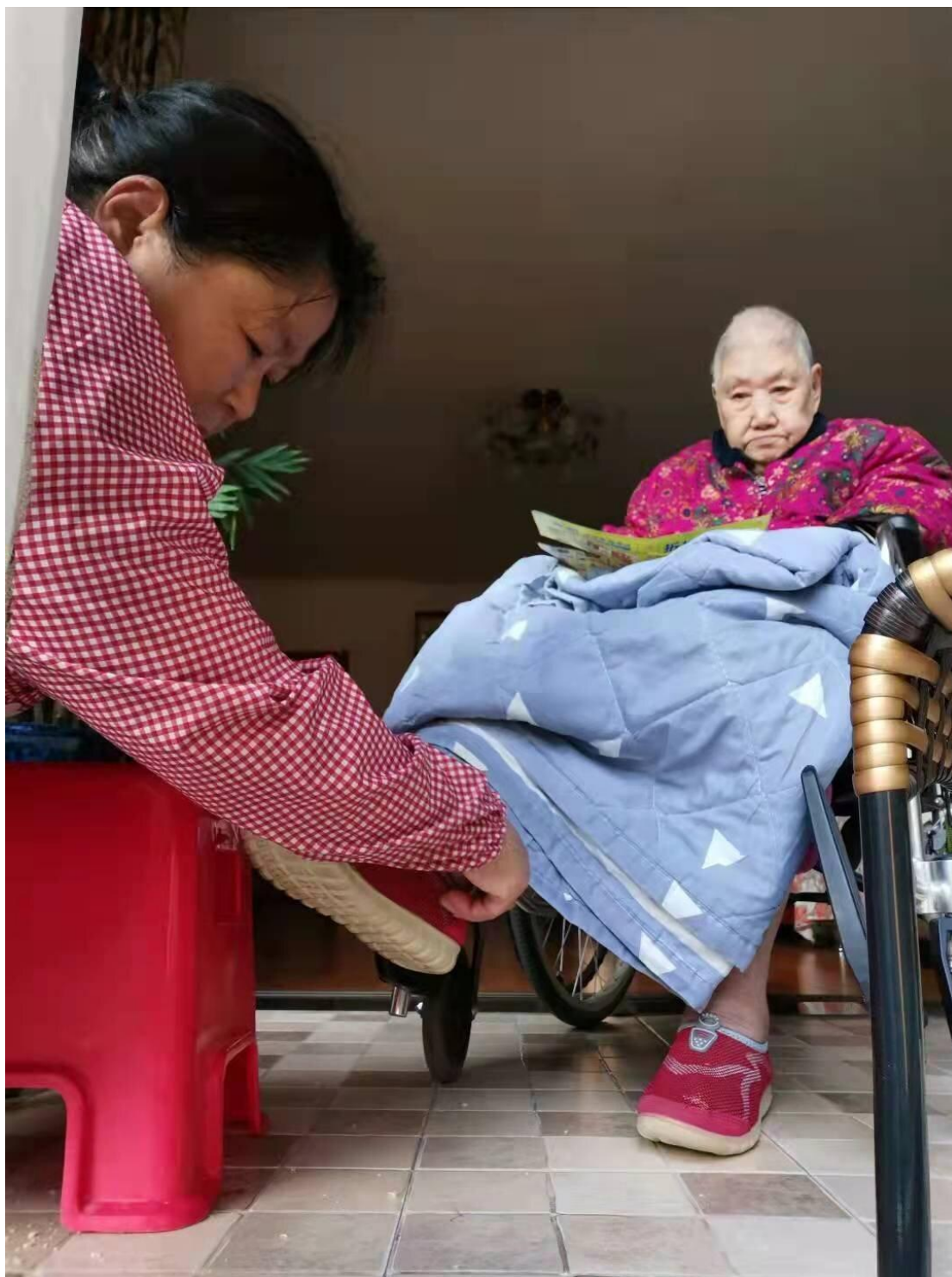
图 4-4 养老康复护理服务