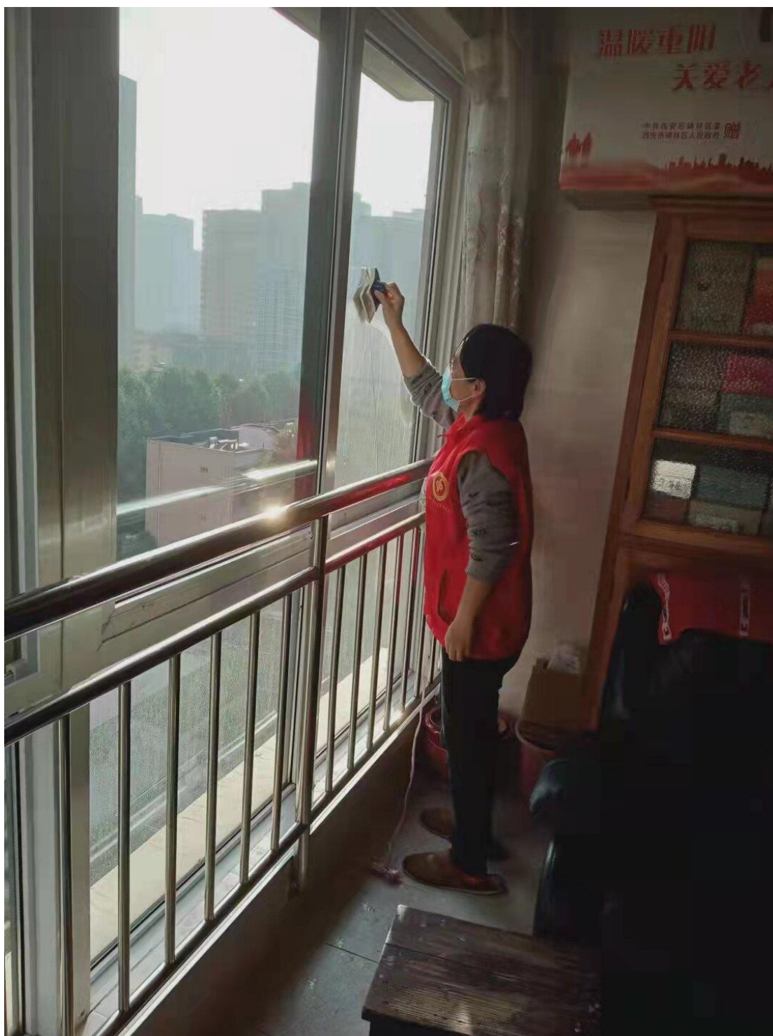
图 4-2 养老机构家政服务