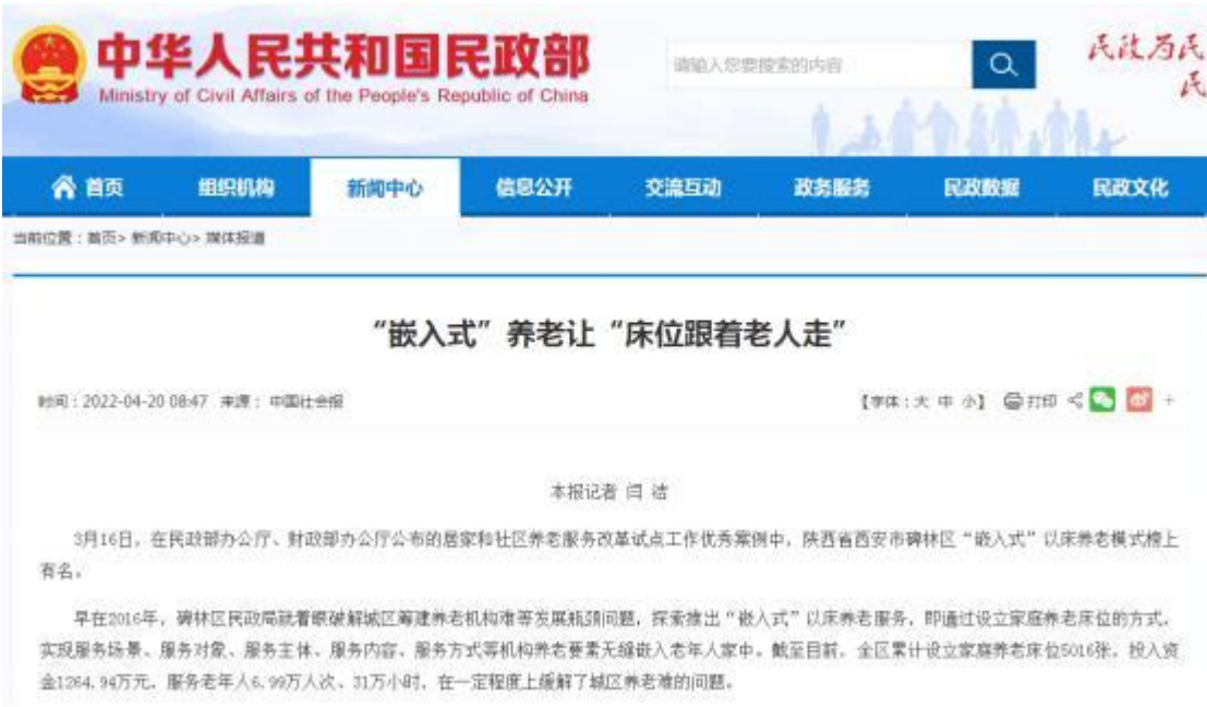
图 3-1 中华人民共和国民政部新闻媒体报道

该项目产生了积极的社会影响，2022年3月16日，在民政部办公厅、财政部办公厅公布的居家和社区养老服务改革试点工作优秀案例中，陕西省西安市碑林区“嵌入式”以床养老模式榜上有名。