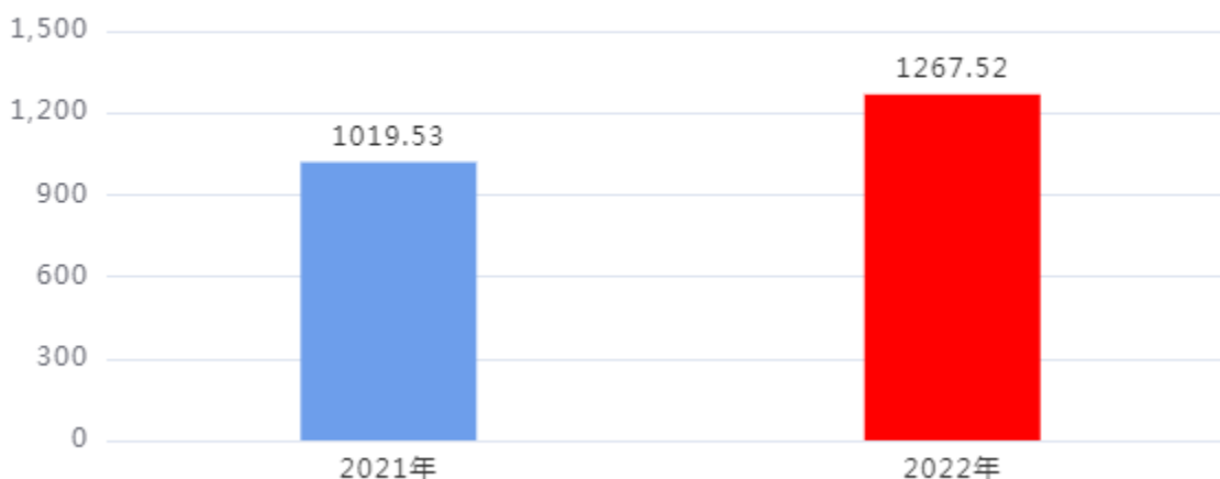
财政拨款支出对比图（单位：万元）

2022年度一般公共预算财政拨款支出年初预算725.84万元，支出决算1,267.52万元，完成年初预算的174.63%，占本年支出合计的100%。与上年相比，财政拨款支出增加247.99万元，增长24.32%，增长的主要原因是：项目支出的拨款增加。