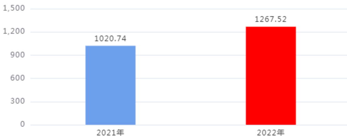
收入、支出决算总计对比图（单位：万元）

2022年度收入总计、支出总计均为1,267.52万元，与上年相比收入总计、支出总计均增加246.78万元，增长24.18%，增长的主要原因是：项目支出的增加。