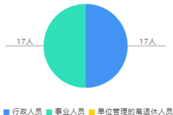
人员情况构成饼图