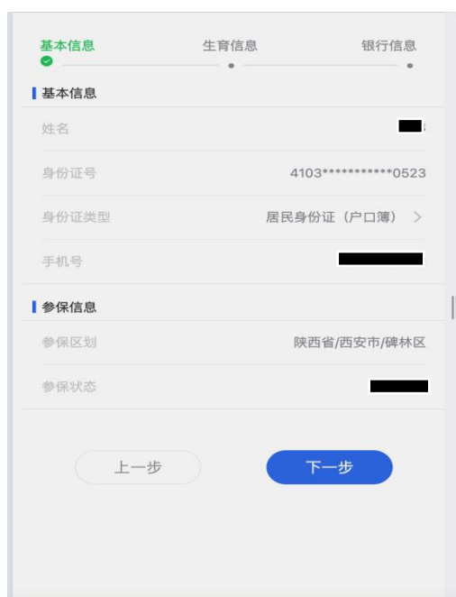
图 4 图片为示例