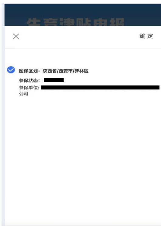
图 3 图片为示例